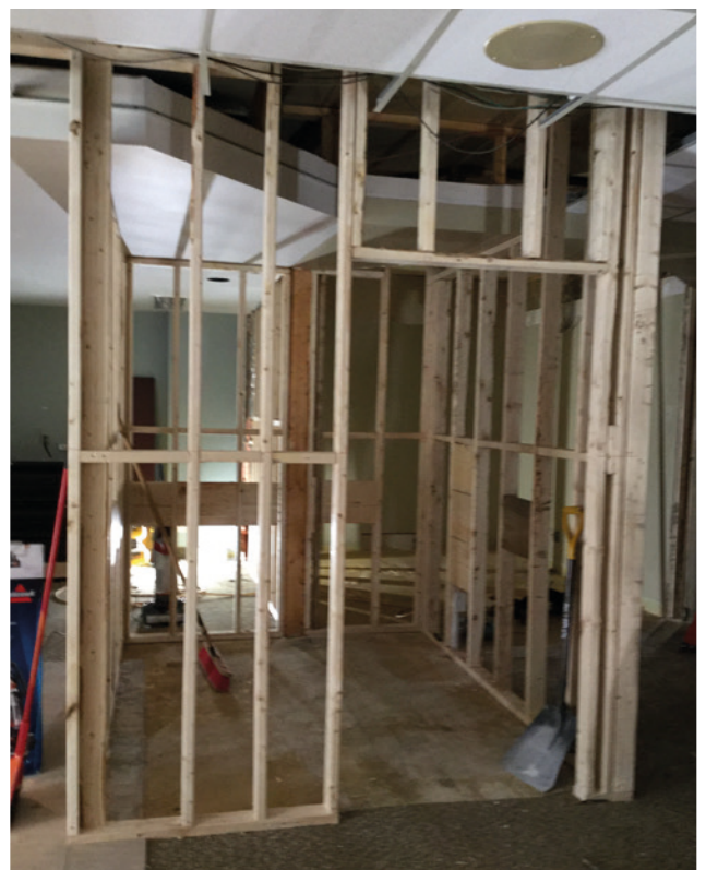
▲ Conception de la salle de bain du rez-de-chaussée.