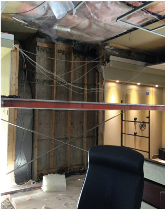
▲ Installation du monte-charges.

Une inauguration aura lieu pour l'ouverture du nouveau local du Centre d'archives. Une date vous sera communiquée ultérieurement.