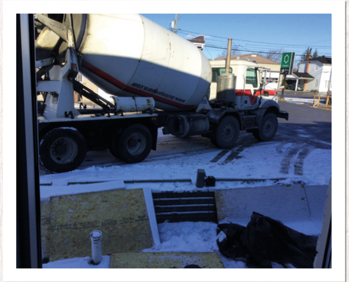
▲ Préparation de la surface pour l'installation de la génératrice extérieure.

Mentionnons que le Centre d'archives de Vaudreuil-Soulanges a bénéficié d'une subvention du ministère des Affaires municipales et de l'Habitation dans le cadre du programme Fonds Région et Ruralité (FRR) pour réaliser les travaux. Nous les en remercions grandement.