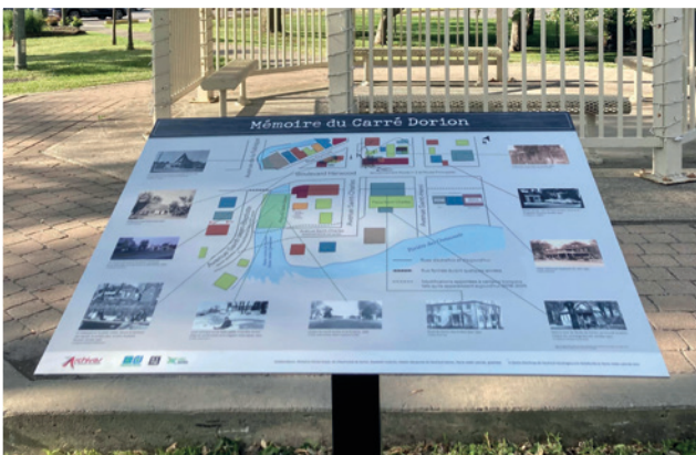
▲ Un des trois panneaux, celui-ci se situe dans le Carré Dorion.

Si vous passez par-là, arrêtez-les voir! Vous y découvrirez de superbes photos illustrant ce secteur autrefois grouillant de vie.