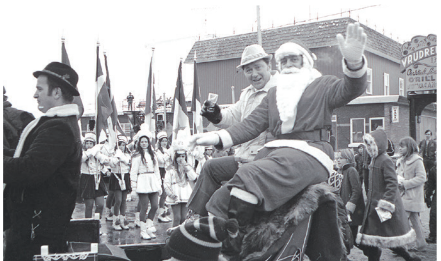
Les parades du Père Noël, toujours populaires! (CAVS, P066-B2,6,3, Dorion, 1971 ou 1972)