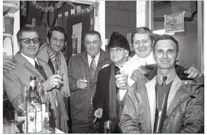
Comme ces hommes rassemblés au restaurant Chalet de Coteau-du-Lac, en décembre 1971, levons nos verres à la nouvelle année remplie de promesses qui débutera bientôt! (CAVS, P066-B1,7,9)