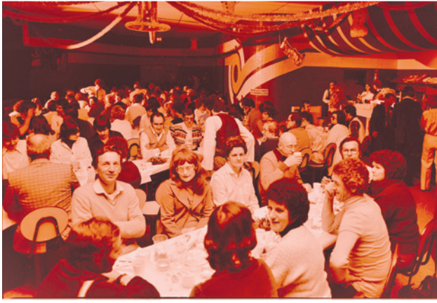
Certains « partys » de bureau auront lieu cette année. Voyez celui des employés du magasin Loyola Schmidt qui a eu lieu en 1979 à la Rou-lathèque, située sur le boulevard Harwood à Dorion.