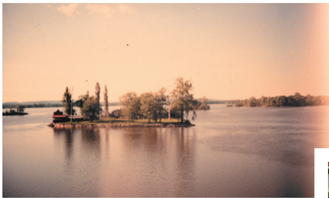
▲ Île Bélique (P191)