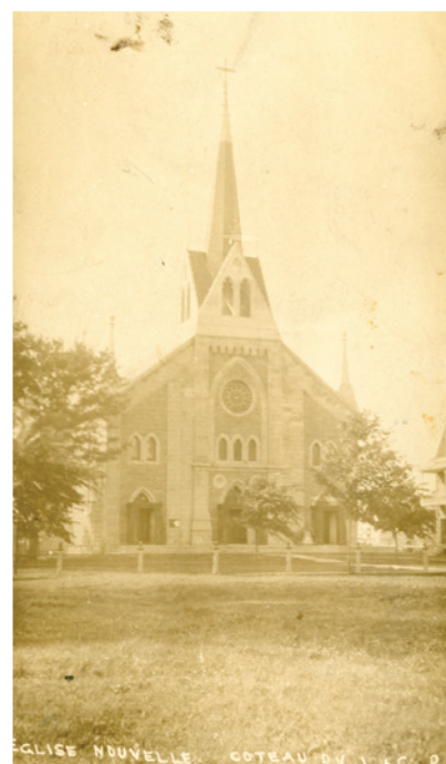
▲ Église de Coteau-du-Lac (P035/E,4,4,3,1)