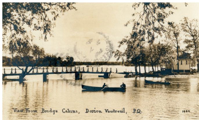
▲ Maison sur l'île derrière les «Bridge cabins» à Dorion tout à côté du pont Taschereau, dans les années 1940. Le parc Sabourin remplace aujourd'hui ce lieu de villégiature.