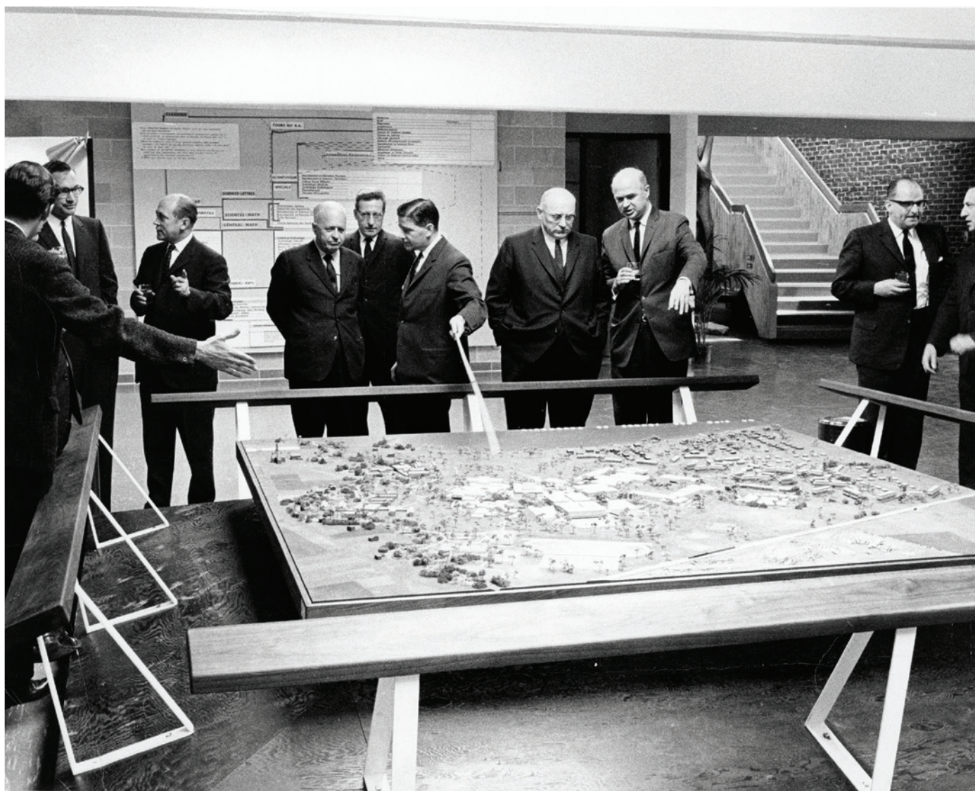
▲ Maquette du campus de la Cité-des-Jeunes, laquelle est pointée par le ministre de l'Éducation de la fin des années 1960, M. Paul Gérin-Lajoie. (P96-E1)