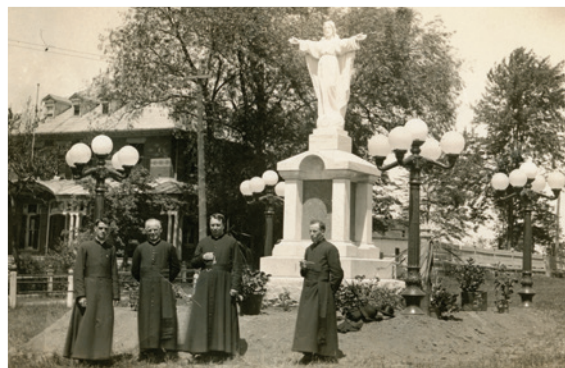
▲ Religieux devant le presbytère de Les Cèdres. (P035/E,4,4,3,1)