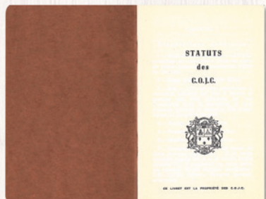
Fonds Ordre de Jacques- Cartier (P095)